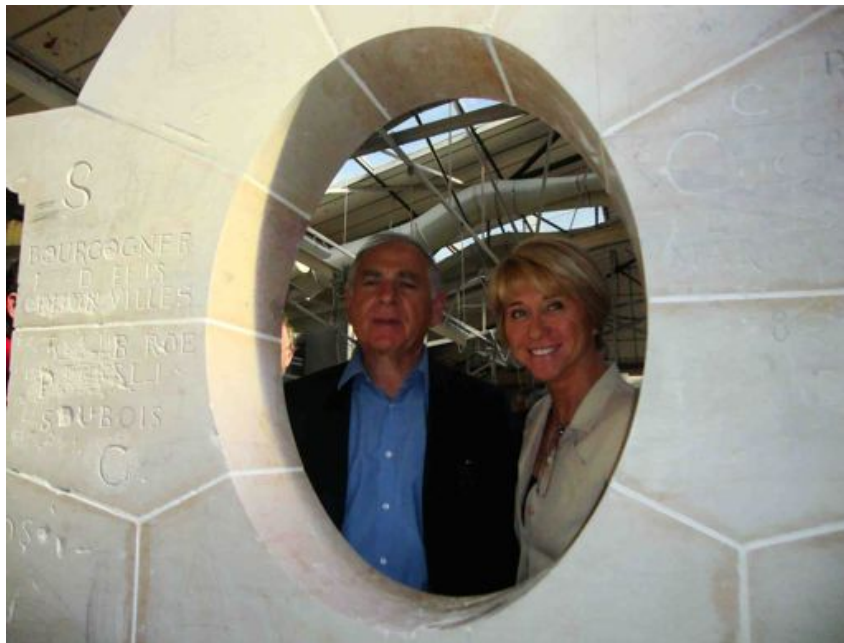
Région et Etat soutiennent la Pierre de Bourgogne