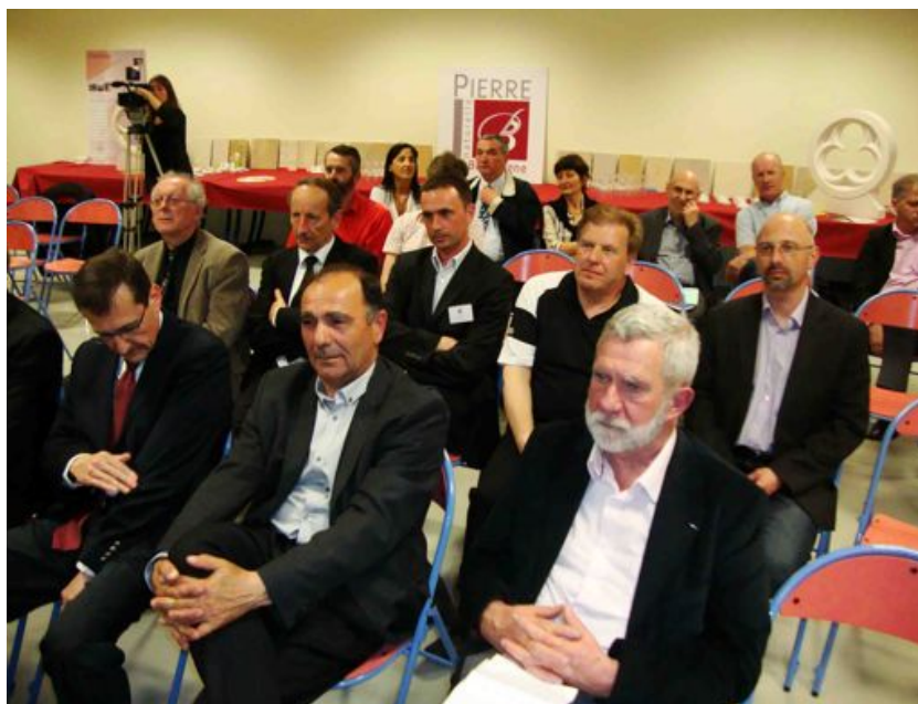
Les professionnels de la filière étaient également présents